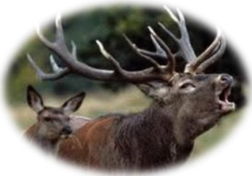
Randonnée à thème : Le brame du cerf Forêt de Chantilly

Les cerfs sont de grands herbivores que l'on trouve dans nos forêts. Males et femelles vivent séparément de décembre à août et se retrouvent pour une période de fécondation de fin août à mi-octobre. Le rut est marqué par le cri rauque et retentissant du male (le brame) que l'on peut entendre à plusieurs kilomètres de distance.